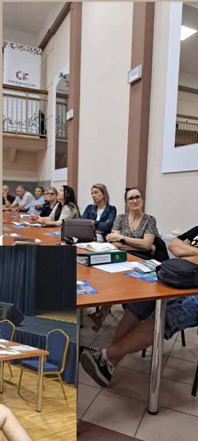
Gmina Lubień Kujawski (05.06.2024 r.)

na lata 2021-2027(LSR)- jej głównych celach, zasadach przyznawania dofinansowania i kryteriach udzielania wsparcia z budżetu LSR oraz typach operacji, które będą miały największe szanse wsparcia z budżetu LSR, informowanie o stanie realizacji LSR. Zaprezentowane zostały również konkursy planowane do ogłoszenia przez LGD w ramach Planu Strategicznego dla Wspólnej Polityki Rolnej 2023-2027 oraz w ramach Funduszu Europejskiego dla Kujaw i Pomorza na lata 2021-2027 – EFS+ . Podczas spotkania przedstawiono harmonogram naboru wniosków na lata