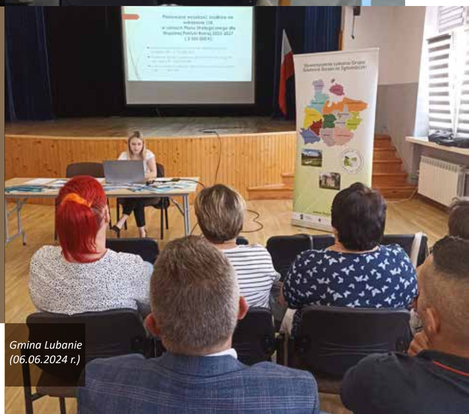
Gmina Lubanie (06.06.2024 r.)

Zebranie z mieszkańcami gmin LGD podsumowano przedstawieniem inwestycji i zadań jakie zostały zrealizowane do tej pory w poszczególnych gminach z udziałem środków LGD. Każdy uczestnik spotkania miał możliwość zgłoszenia swoich pomysłów i potrzeb dotyczących inwestycji na obszarze LSR. Dzięki rozmowie z mieszkańcami pracownicy LGD mogli poznać oczekiwania i potrzeby rozwojowe gmin. W przyszłym roku planujemy również zorganizować takie spotkanie w każdej gminie LGD.