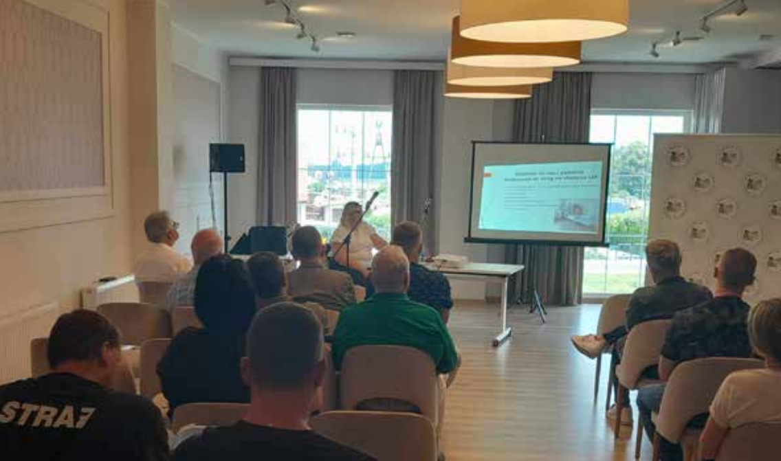
Gmina Baruchowo (03.06.2024 r.)