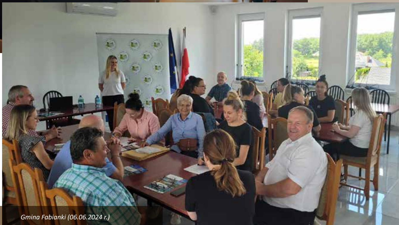
Gmina Fabianki (06.06.2024 r.)

2024 – 2025 wraz z planowaną kwotą środków przeznaczoną na dofinansowanie projektów w konkursach LGD.