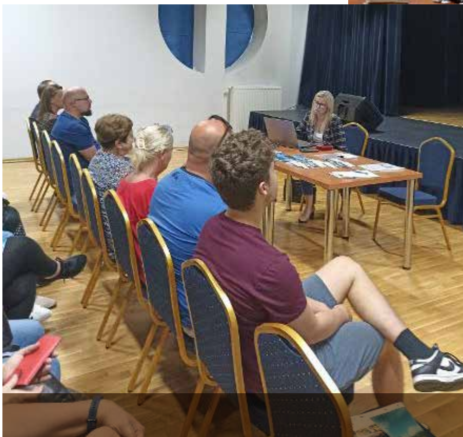
Gmina Chocień (10.06.2024 r.)